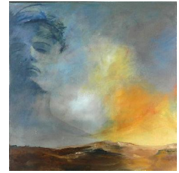
Songe 950 eur