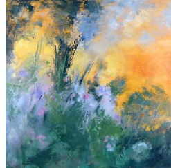
Inspiration nature 850 eur