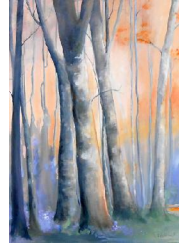
Forêt en hiver 650 eur