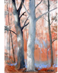
Forêt bleue 650 eur