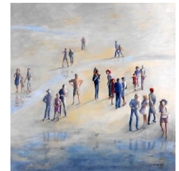
Rendez-vous sur la plage 850 eur