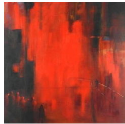
Funambule rouge 2 850 eur