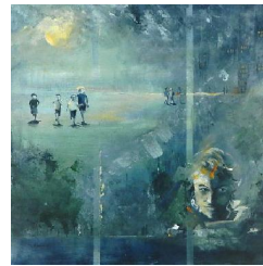
The mentalist 850 eur