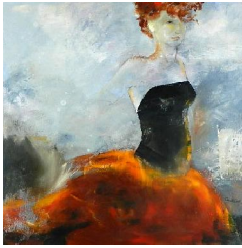
Parfum exotique 850 eur