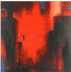
Acrobate rouge 850 eur