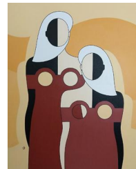
Les Oasiennes 950 eur