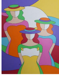
Jardin d'ete 950 eur