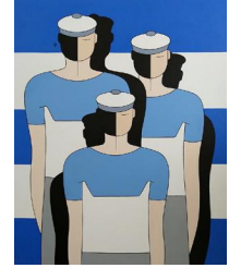
Les matelots 950 eur