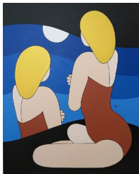
Reverie 950 eur