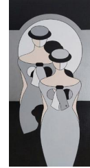
Models 750 eur