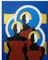
Discographie 950 eur