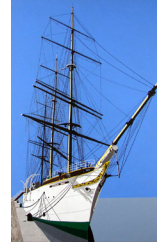
Duchesse Anne Dunkerque 950 eur