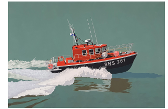
SNS 281 850 eur