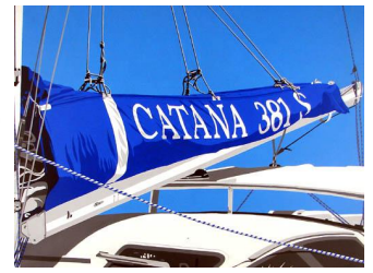
Catana 950 eur