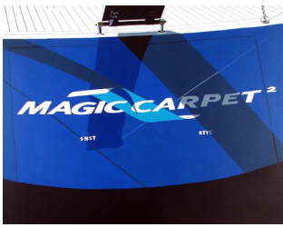
Magic Carpet 950 eur