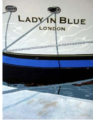
Lady in blue 950 eur