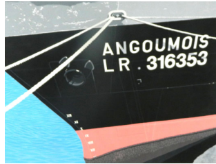
Angoumois LR316353 950 eur