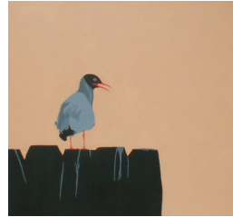
Mouette au soleil couchant 950 eur