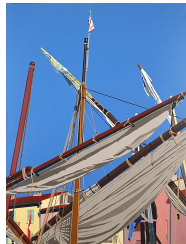
Les voiles latines de St Tropez 950 eur