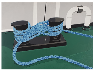
Amare du Triomphant 950 eur