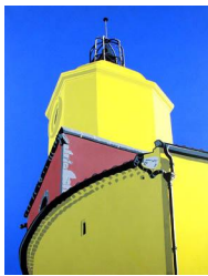
Le clocher 0 eur