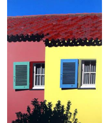
Byblos 0 eur