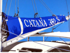
Catana 0 eur