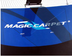
Magic Carpet 0 eur