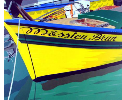
M'ssieur Brun 0 eur