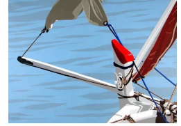
Le Capian rouge 0 eur

Vous présente une exposition de Michel Dumont St Tropez 2