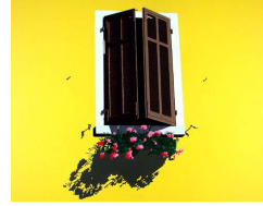
Volets 0 eur