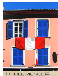
LE CLEMENCEAU Le Clemenceau 0 eur