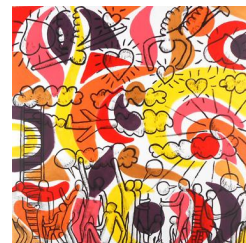
I'm happy 780 eur