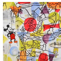
Mickey 520 eur