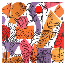
The painter 780 eur