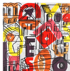
The city 520 eur