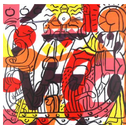
Blow-up 780 eur