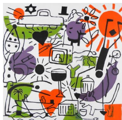
The fall of Icarus 780 eur