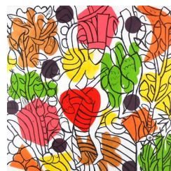
The spring 780 eur