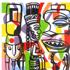
The kings 780 eur