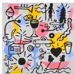
Loving boat 520 eur