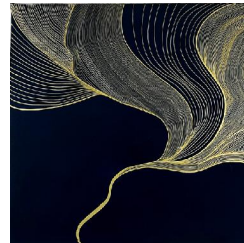
Eole 2 650 eur