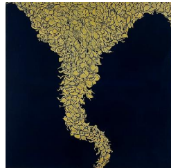
Eole 1 650 eur