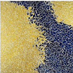
Riviere 650 eur