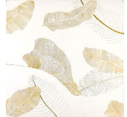
La premiere fois 650 eur