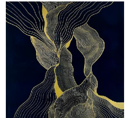
Eole 3 650 eur