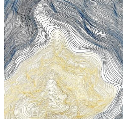
Ile 650 eur