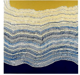
La plage 650 eur