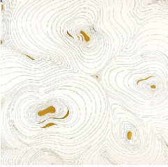
Les collines 650 eur