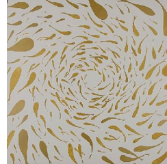
Trou blanc 650 eur