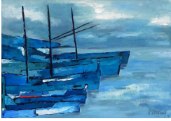
Brume 400 eur