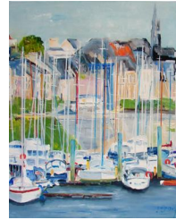
Saint Valérie 400 eur