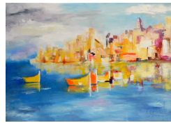
Evasion 500 eur