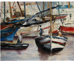
Sortie du Port 450 eur