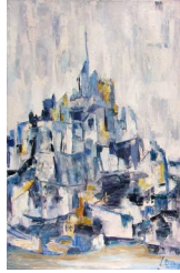
Donjons et dragons 400 eur