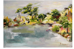
La crique aux pins 500 eur