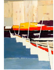
Courrages 400 eur