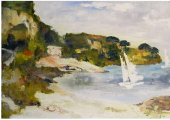
Petite terrasse 500 eur